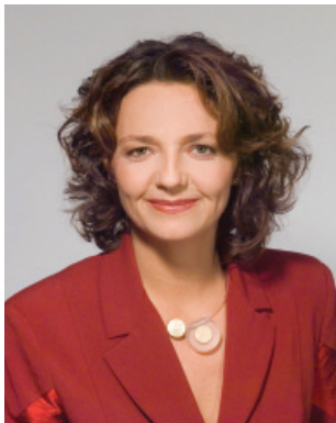
Abg. z. NR Carina Felzmann Vorsitzende arge creativ wirtschaft austria carina.felzmann@wko.at

"Das iP ImpulsProgramm creativwirtschaft ist sicher eines der erfolgreichsten Projekte der arge creativ wirtschaft austria. Unser Ziel ist es, Österreich national und international als erfolgreichen Kreativstandort für die Wirtschaft zu positionieren. Dazu vernetzen wir Menschen, Ideen, Projekte, Firmen und Institutionen und sind als Lobbyisten für das Thema unterwegs."